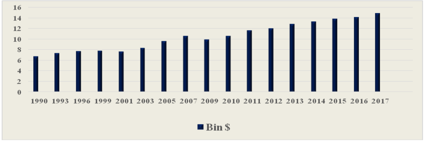
Şekil 2: Türkiye'nin Kişi Başına Düşen GSYİH Miktarları (2010 Sabit Fiyatlarla) Bin $