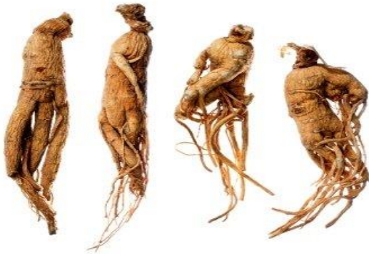
Resim 1: Farklı adamotu bitkilerine ait insan bedenini anımsatan kökler.

Antik çağlardan bu yana insanlığın hem korktuğu hem de kutsallaştırdığı adamotu, adını gövdesi, kolları ve bacakları ile tıpkı bir insana benzeyen kökünün gizemli dış görünüşünden almıştır (Resim 1). İnanışa göre, adamotunun köklerini topraktan koparıldığında acı içinde çılgık atar ve kendisini topraktan ayırmaya çalışan kişiye ölüm getirirdi. İşte bu inançtan ötürü adamotu köpeklere söktürülürdü (Resim 2) (Gezgin, 2007, s.16). İngilizce ismi 'mandrake' olan bu bitki aynı zamanda baştan çıkarıcı bir afrodizyak olarak görülmüştür. Adamotunun etkilerinin öylesine kuvvetli olduğu düşünülür ki, onun insanı cinnete sürüklediğine bile inanılmıştır. Bununla birlikte bitkinin sihirli olduğu düşünülmüş ve tılsım olarak kullanılmıştır (Andrews, 2000, s.135). Patlıcan ailesinden gelen bu bitki daha çok büyülerde kullanılması ile tanınmaktadır. Pek çok toplumda tılsımına inanılan bu bitkinin, bir kişinin aşık edilmesi, bir dileğin gerçekleşmesi, çocuğu olmayanlara ve tüm hastalıklara şifa olması için kullanıldığı da bilinmektedir. Aynı zamanda uyuşturucu özelliğe sahip olan bu bitkinin bereket getirdiğine, cinsel istek uyandırdığına da inanılmaktadır. Bundan dolayı "adamotu elması" ve "aşk elması" olarak da adlandırılmaktadır (Gezgin, 2007, s.15-16).