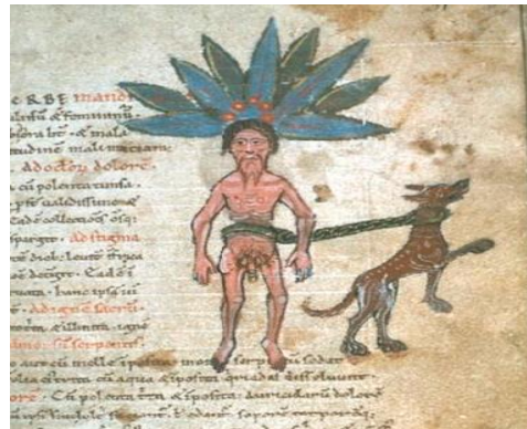
Resim 2: "Mandragora mascula", Herbarius of Pseudo-Apuleius'dan minyatür, yakl. 1070-1100, Oxford, Bodleian Kütüphanesi, MS. Ashmole 1431, fol. 31r.