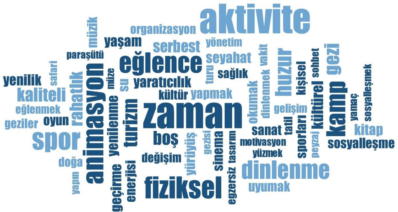
Şekil 1. Otel Yöneticilerinin Rekreasyon Kavramına Yönelik İlişki Kurdukları Kelimelerin Frekanslarına Göre Kelime Bulutu Görseli

Otel işletme yöneticilerinin kelime ilişkilendirme testine yönelik vermiş olduğu yanıtların dağılımları Tablo 2’de yer almaktadır. Sonuçlara göre araştırmaya katılan 43 otel yöneticisinin tamamı 3 kelimeyi sorunsuz şekilde yanıtladıkları tespit edilmiştir. Yöneticilerden bir tanesi 4 kelime üretirken 39 yöneticinin rekreasyon kavramına yönelik 7 farklı kelime yazdıkları görülmektedir. Bununla birlikte, araştırma formunda yazmaları istenen 10 farklı kelimenin tamamını oluşturabilen yöneticilerin sayısının ise 32 olduğu anlaşılmaktadır. Sonuç olarak yöneticilerden rekreasyon kavramına yönelik 102 farklı kelime olmak üzere toplamda 392 adet kelime elde edilmiştir. Yöneticilerin en fazla tekrar ettikleri 10 kelime; zaman (f=33), aktivite (f=32), fiziksel (f=21), animasyon (f=20), spor (f=20), eğlence (f=19), kamp (f=18), dinlenme (f=16), huzur (f=14) ve gezi (f=12) olarak belirlenmiştir. Otel yöneticilerinin rekreasyon kavramı ile ilişki kurdukları kelimeler, frekans değerleri dikkate alınarak oluşturulmuştur. Kelime bulutu görseli Şekil 1’de görülmektedir.