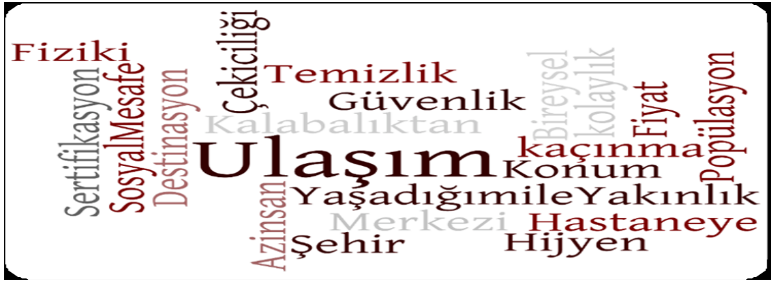
Şekil 1: Covid-19 Sonrası Turistlerin Tatil Tercihlerindeki Kriterlerine Ait Kelime Bulutu

Örneğin pandemi öncesi bireylerin yaşam standartlarına bağlı olarak tatil tercihlerini küçük veya büyük konaklama işletmelerinde geçiren çoğu turistin, pandemi koşullarında daha güvenilir gördüğü farklı konaklama seçeneklerine yönelttiği gözlemlenmektedir. Bu seçenekler arasında butik oteller, oda-kahvaltı veya sadece oda konseptli oteller, apart oteller, konut kiralama tercihi, kamp ve karavan turizmi gibi alternatif turizm türleri yer alır. Aynı şekilde pandeminin sebep olduğu fiziksel mesafe kaygısı ile yat turizminin de popülaritesi artmıştır (Çetinkaya vd., 2020). 2020 yılında çoğunluğunun turizm akademisyenleri olduğu bir çalışmada "Sizce Koronavirüs (Covid-19) salgınının Dünya'da turist davranışları üzerinde ne gibi etkileri olacaktır?" sorusunun cevabına büyük bir çoğunluk turistlerin covid-19 kaynaklı resort otel ve her şey dahil sistemini bırakarak daha küçük butik otelleri, devremülk yazlık gibi konaklama türlerini tercih edeceklerini belirtmiştir (Türker,2020). Yapılan diğer çalışmalar da göstermiştir ki covid-19 salgınından sonra ortaya çıkan harita, turistleri diğer turizm alanları ile kıyaslandığında kamp turizmine daha çok yönlendirmiştir. Çünkü covid-19 ölçeği açısından değerlendirildiğinde sosyal mesafe korunarak gerçekleştirilebilen en iyi destinasyon kamp alanlarıdır (Craig & Karabaş, 2020; Craig vd., 2021).