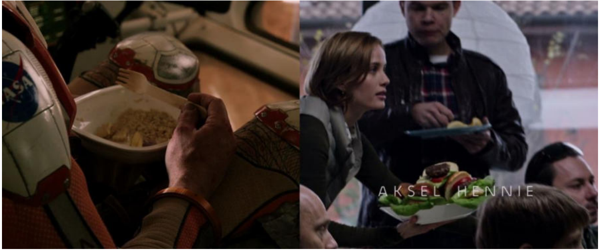
Görsel 4. Hayatta kalma ve tek başına oluş ile dünyada gündelik yaşam ve sosyalliğin yemeğin renkliliğine yansımaları (Scott, 2015).

Bir başka zıtlık ise patates bitkisinin gösteren olarak rol aldığı iki sahnede ortaya çıkmaktadır. Watney, patatesleri toprağa ektikten sonra ilk filizin toprağı yarıp çıkması, “filizlenen” umutları, yani yaşamı temsil etmektedir (Görsel 5). Çünkü Watney, ancak patateslerin sağlıklı bir şekilde büyümesi halinde hayatta kalabilecek besini sağlayabilecektir. Hab’ın kapısı havaya uçtukten sonra donarak ölen patates bitkileri ise ölümü simgelemektedir. Çünkü planlananın aksine, ortaya çıkan yeni durumda yeterli besin kaynağı olmayacaktır. Özellikle, Hab’ın kapısı havaya uçtukten sonra Watney’in, karanlıktaki tarlasını el feneri yardımıyla kontrol ettiği sahne korku filmlerine benzerliği ile bu anlamı pekiştirmektedir (Görsel 5).