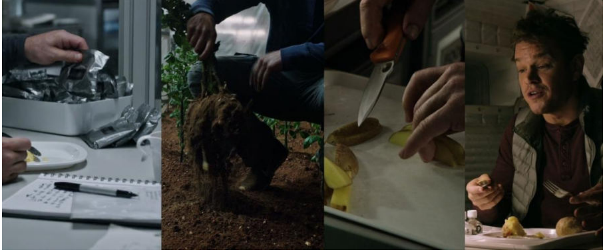
Görsel 6. Erzak paketleri ve “tarladan çatala” dönüşümü (Scott, 2015).

Watney’in patatesleri ekmeden önce Hab içerisinde oluşturduğu tarlayı sürdüğü, filizlenerek büyüyen ilk patates bitkilerini kontrol ettiği ve ilk patateslerden bir kısmını yeniden ektiği sahnelerde Hab’ın kamerasının ekrana yansıdığı üç ayrı plan bulunmaktadır. Kamera kaydı Mars’taki görev gününü, basınç, oksijen seviyesi ve sıcaklık gibi değerleri ekrana taşımanın yanında ilgili kameranın Hab’ın hangi bölümünü çektiğini de göstermektedir. Watney’in patates tarlasını gösteren kamera görüntüleri Hab’ın “Mutfak” bölümüne aittir. Bu bağlamda “tarladan çatala” okuması sembolik olarak “tarlanın” “mutfak” olarak kamerayla görüntülenmesi ile pekişmektedir (Görsel 7).