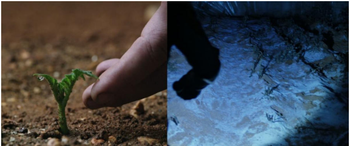
Görsel 5. Umut ve Ölüm (Scott, 2015).

Bir başka zıtlık ise patates bitkisinin gösteren olarak rol aldığı iki sahnede ortaya çıkmaktadır. Watney, patatesleri toprağa ektikten sonra ilk filizin toprağı yarıp çıkması, “filizlenen” umutları, yani yaşamı temsil etmektedir (Görsel 5). Çünkü Watney, ancak patateslerin sağlıklı bir şekilde büyümesi halinde hayatta kalabilecek besini sağlayabilecektir. Hab’ın kapısı havaya uçtukten sonra donarak ölen patates bitkileri ise ölümü simgelemektedir. Çünkü planlananın aksine, ortaya çıkan yeni durumda yeterli besin kaynağı olmayacaktır. Özellikle, Hab’ın kapısı havaya uçtukten sonra Watney’in, karanlıktaki tarlasını el feneri yardımıyla kontrol ettiği sahne korku filmlerine benzerliği ile bu anlamı pekiştirmektedir (Görsel 5).