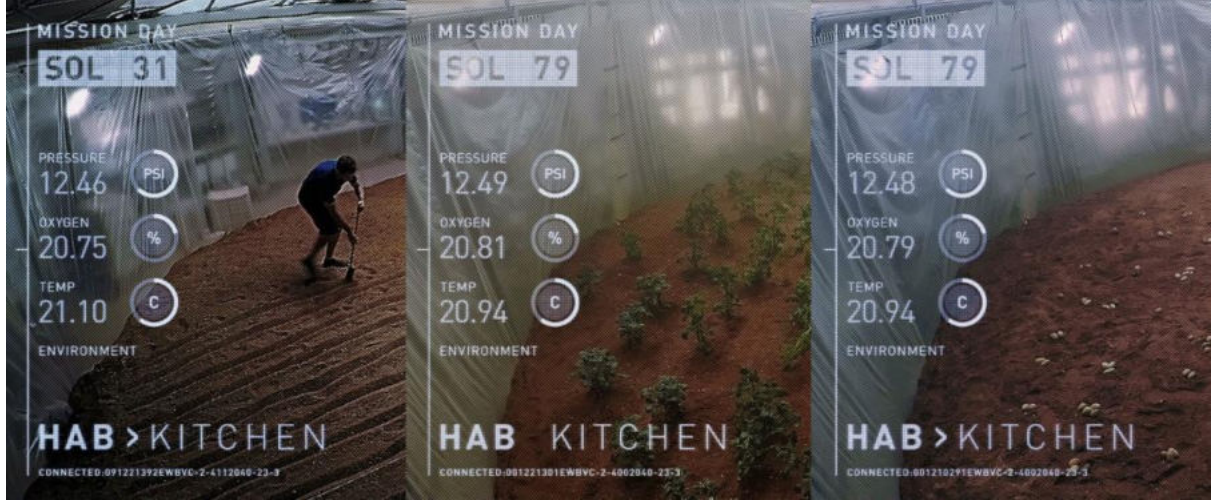
Görsel 7. Tarlanın mutfağa dahil oluşu (Scott, 2015).

Watney’in patatesleri ekmeden önce Hab içerisinde oluşturduğu tarlayı sürdüğü, filizlenerek büyüyen ilk patates bitkilerini kontrol ettiği ve ilk patateslerden bir kısmını yeniden ektiği sahnelerde Hab’ın kamerasının ekrana yansıdığı üç ayrı plan bulunmaktadır. Kamera kaydı Mars’taki görev gününü, basınç, oksijen seviyesi ve sıcaklık gibi değerleri ekrana taşımanın yanında ilgili kameranın Hab’ın hangi bölümünü çektiğini de göstermektedir. Watney’in patates tarlasını gösteren kamera görüntüleri Hab’ın “Mutfak” bölümüne aittir. Bu bağlamda “tarladan çatala” okuması sembolik olarak “tarlanın” “mutfak” olarak kamerayla görüntülenmesi ile pekişmektedir (Görsel 7).