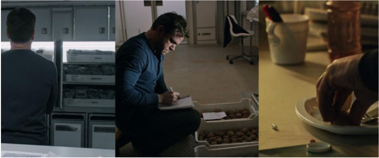
Görsel 8. Erzakların ve patateslerin depolanma konumları ile patatesin vitamin takviye hapının tozuna batırılıp yenmesi (Scott, 2015).