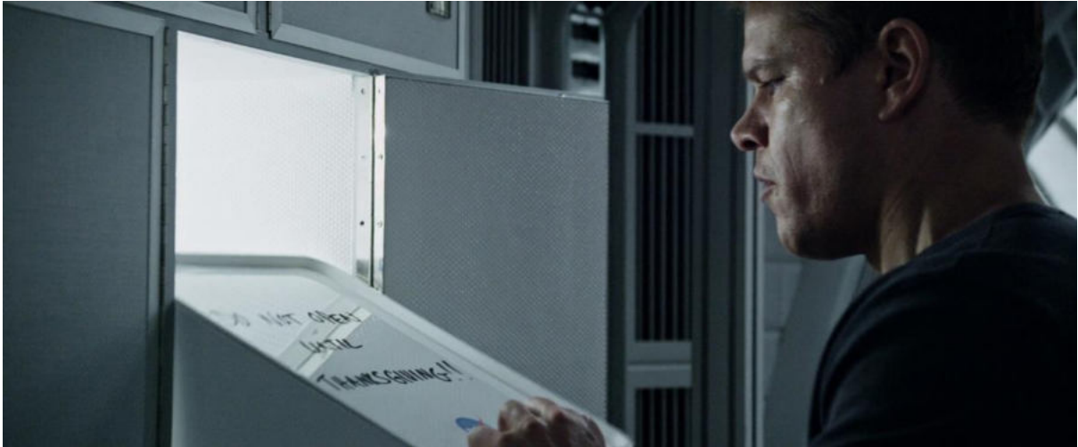
Görsel 1. Hab'da patatesin keşfi (Scott, 2015).

Filmde gösterildiği en basit anlamıyla patates, tarihsel bağlamda olduğu gibi “hayatta kalma” ile özdeşleşmektedir. Kurtarılanaya kadar geçen süre içerisinde Watney için patates, adeta tarihin bir bölümünde İrlanda'nın büyük kesimi için olduğu gibi, “hayati” öneme sahip olmuştur. Avrupa'nın 1750-1950 yılları arasında dünyaya hakimiyet kurmasının patates sayesinde mümkün olması gibi (McNeill, 1999) Watney de patates sayesinde Mars'ı, kendisinin de dile getirdiği üzere, “kolonileştirmiştir”. Bu bağlamda patatesin anlatı içerisinde kullanımı patatesin toplumsal tarihi ile benzerlik göstermektedir. Nitekim patates mürettebatın görev süresinde beslenmesini sağlayacak vakumlu erzak paketlerinden birisi değildir; hayatta kalma mücadelesinde işe yarayabilecek nesnelere araştırırken Watney tarafından Hab'daki kutulardan birinde “keşfedilir” (Görsel 1).