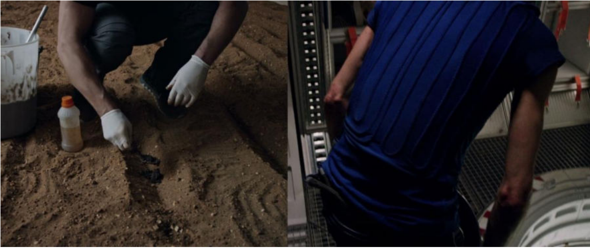
Görsel 2. Mars'ta hayatta kalmanın ilk günleri ile son günleri arasındaki kol kalınlığındaki farklılık (Scott, 2015).

Film genelinde karıştıkların kullanımını patates özelinde de görmek mümkündür. Örneğin Watney erzak listesini çıkarırken yazdığı kâğıtta “Dana Gulaş”, “Dana Strogonof”, “Tatlı Ekşi Soslu Tavuk” veya “Peynir Soslu Makarna” gibi sadece isimleri bile iştah açıcı olan ve zengin malzeme içeriğine sahip çeşitli ürünler bulunmaktadır. Fakat filmin devamında ekrana yansıyan fırınlanmış sade patates, erzakların niteliği ile karıştıklık oluşturmaktadır. Bu bağlamda fırınlanmış sade patates bir gösteren olarak “yokluğa” işaret etmektedir (Görsel 3).