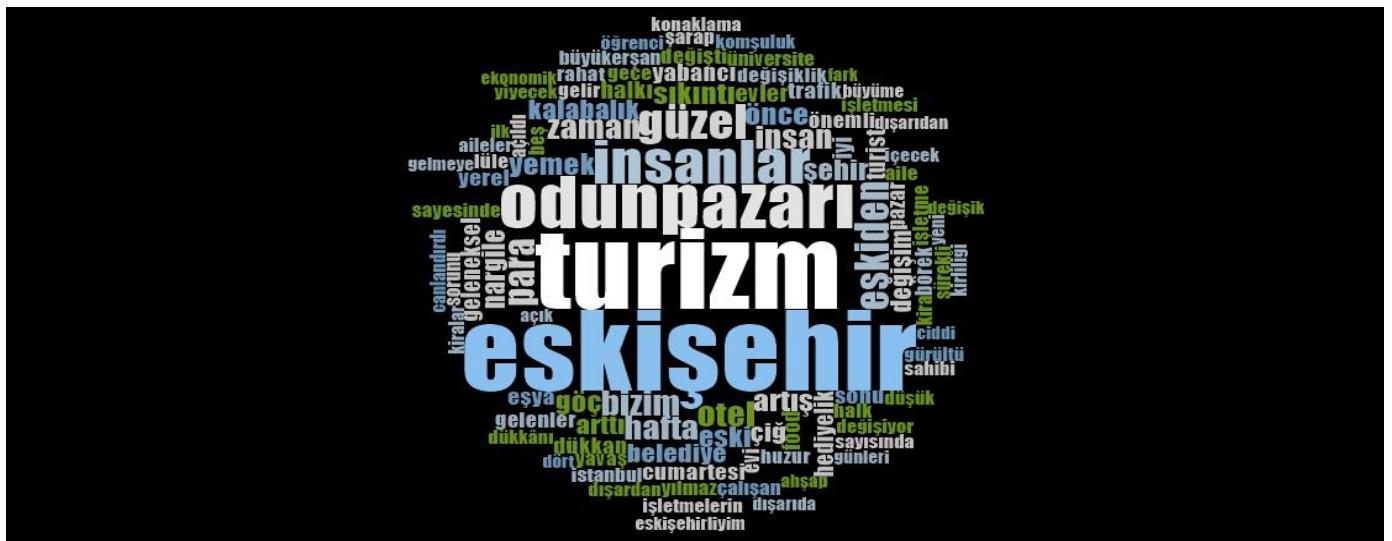
Şekil 2. Kelime Bulutu (Word Cloud)

Yapılan analizler neticesinde daha geniş perspektiften bakmak amacıyla oluşturulan bir diğer raporlama biçimi ise kelime bulutudur (Word Cloud). NVivo programının bir çıktısı olan bu raporlama biçiminde katılımcıların görüşmelerinde en sık tekrar edilen, öne çıkan kelimelerin görselleştirilerek sunulmasıdır. Bu sayede sorgulama, yani (query) yapabilmeye olanağı vermektedir. Bu şekilde görüşme içeriklerinden en çok tekrar eden kelimelerin analizi yapılarak bütüncül bir bakış açısı getirilmiştir.