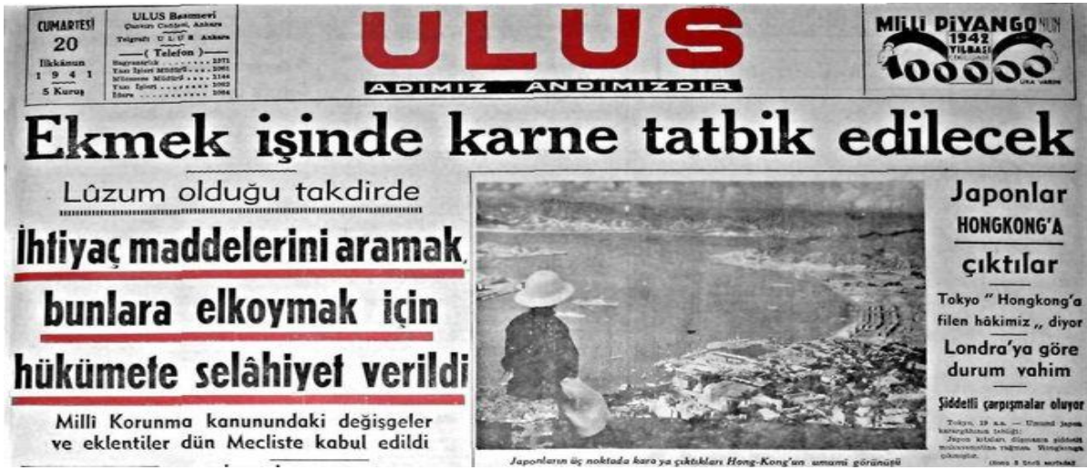
Resim 1. 1941 Yılında Yayınlanan Ulus Gazetesi (Gastearşivi, 2014)

Mücadele edilmeye çalışılan pahalılık ve gıda dağıtım ve erişimindeki sıkıntılara ek olarak salgın hastalıklar da toplumda yükseliş göstermiştir. Barınma sorunuyla birlikte gecekondu yerleşimleri ortaya çıkmış, özellikle fakir ailelerde boşanmalar yaşanmıştır. Çocuk ölümleri ve suçlarının yükselmesi, eğitimde aksamalara, kimsesiz çocukların artmasına ve dilendirilmesine yol açmıştır (Baskıcı, 2007: s.303).